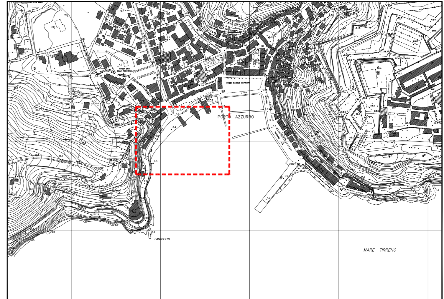
ESTRATTO DI AEROFOTOGAMMETRIA - scala 1:5000