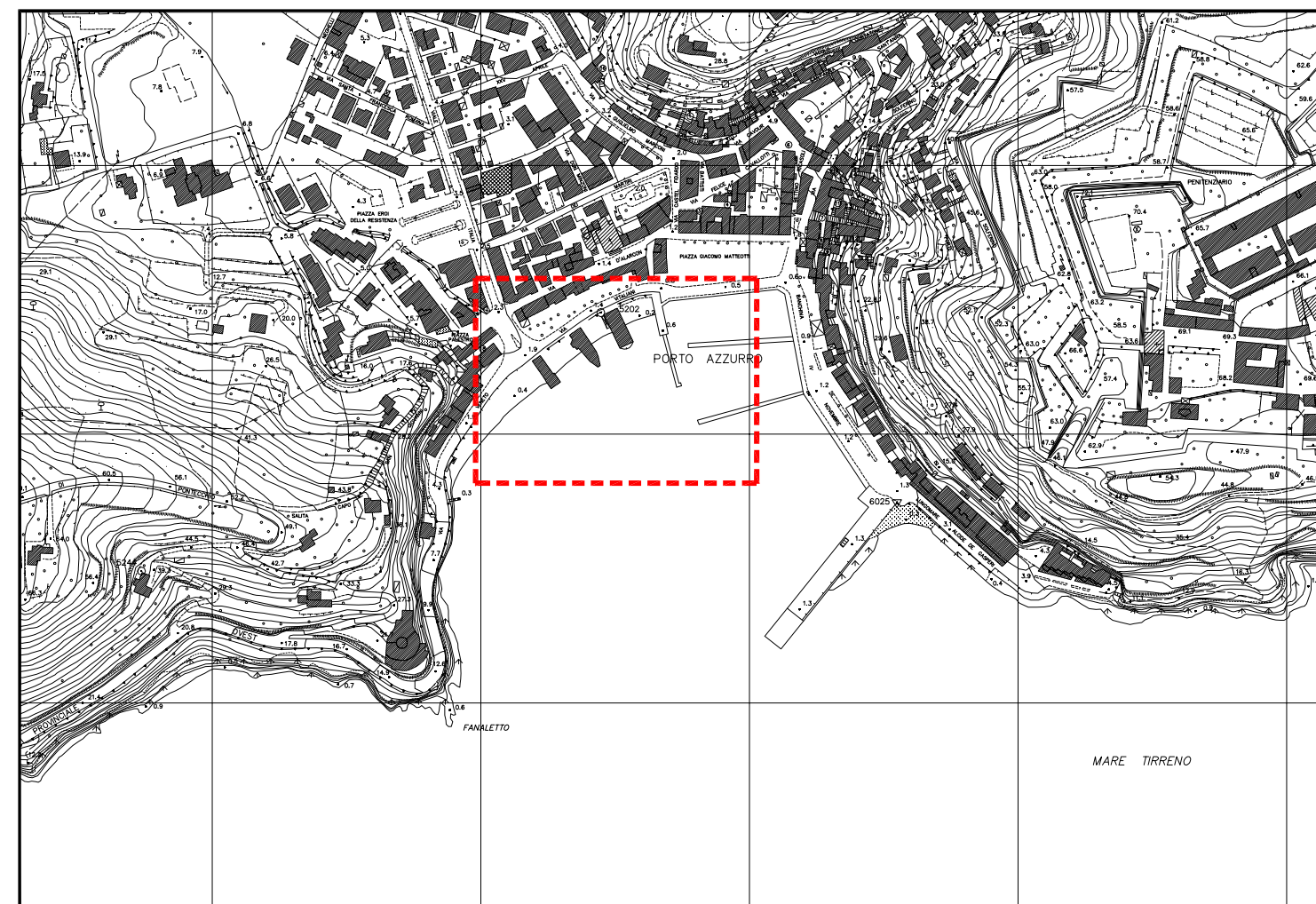
ESTRATTO DI AEROFOTOGRAMMETRIA - scala 1:5000