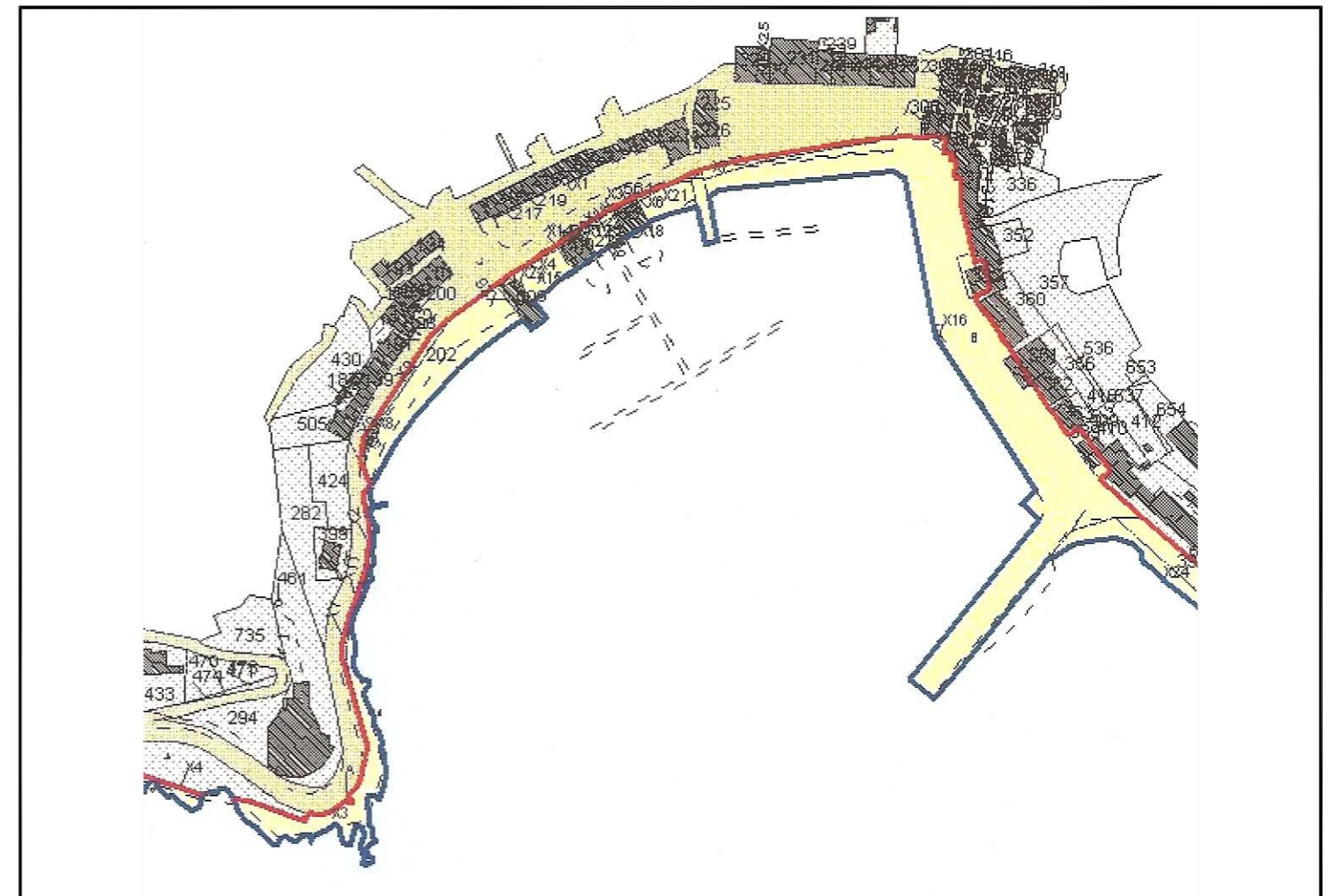
ESTRATTO DI MAPPA CATASTALE - scala 1:3000