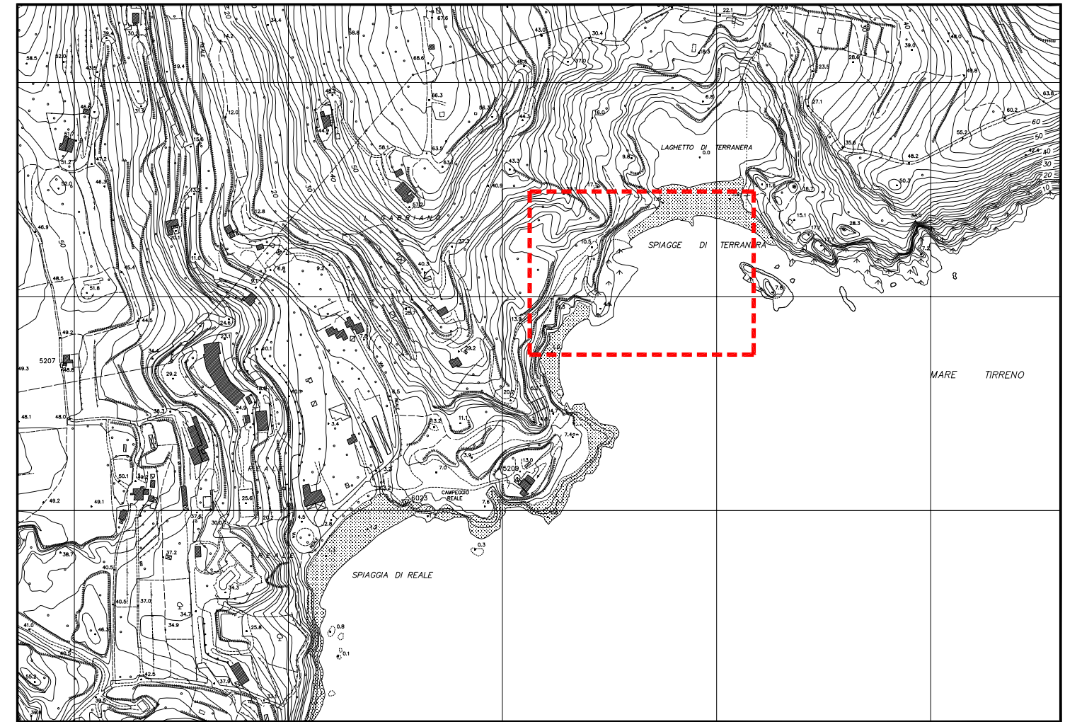
ESTRATTO DI AEROFOTOGRAMMETRIA - scala 1:5000